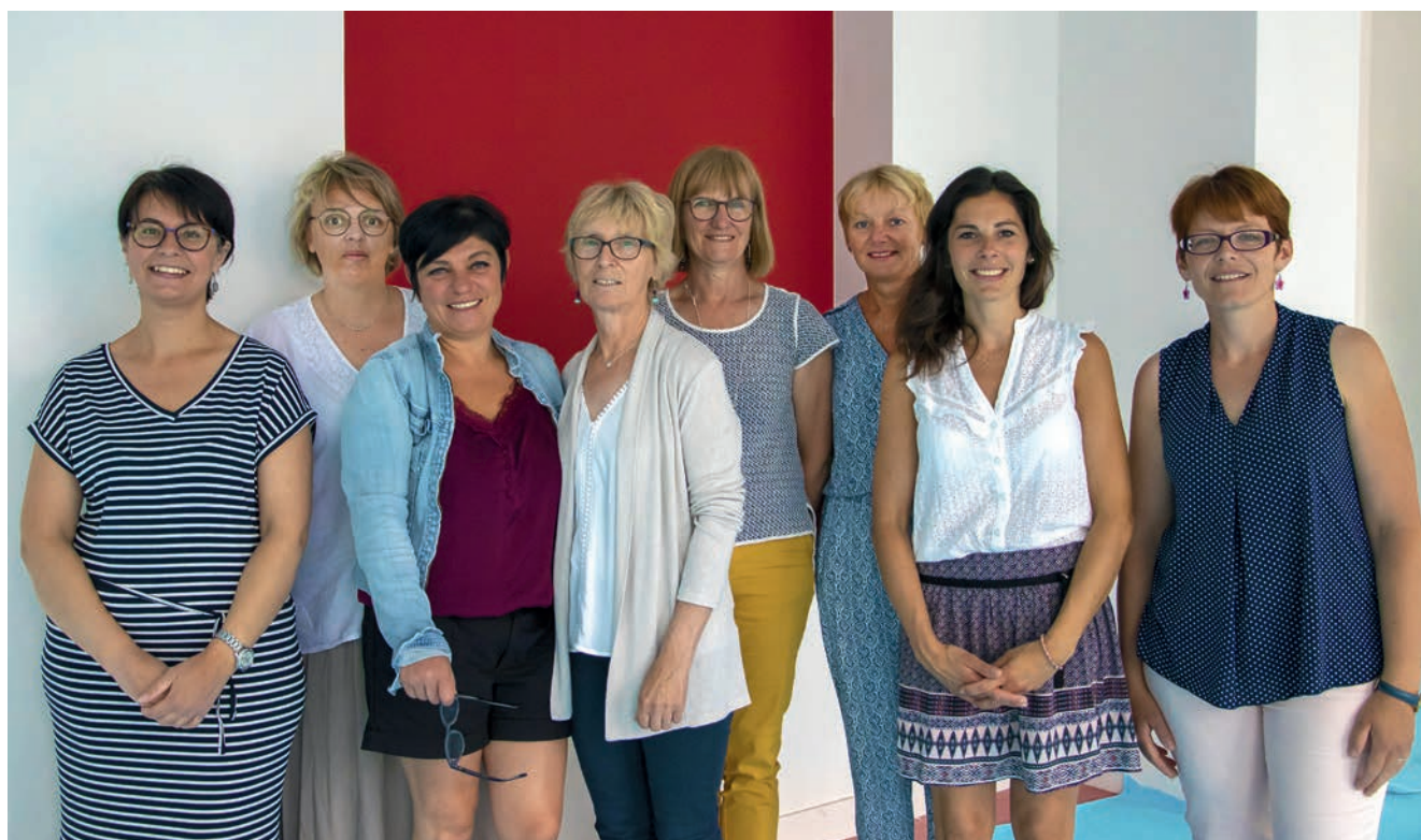
L'équipe d'Arc-en-ciel et du Relais Assistants Maternels en visite dans leurs futurs locaux.

modifications. Les enfants vont désormais fonctionner en sections : une pour les « non marcheurs » et une pour les « moyens-grands ». L'accès à Familia est sécurisé par un système de contrôle d'accès.