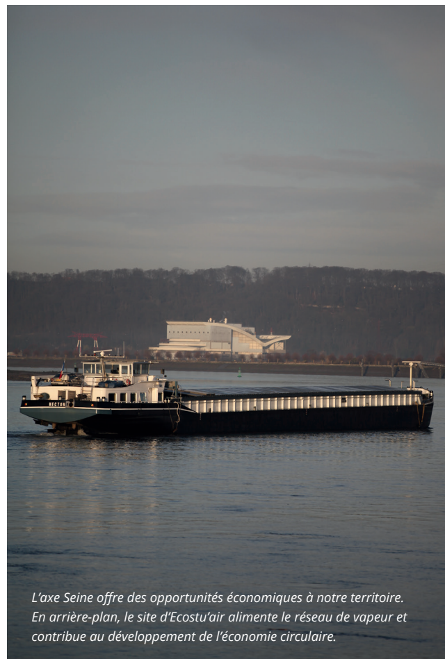
L'axe Seine offre des opportunités économiques à notre territoire. En arrière-plan, le site d'Ecotu'air alimente le réseau de vapeur et contribue au développement de l'économie circulaire.