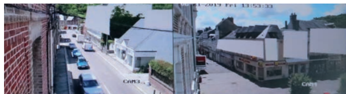
Exemples de masquages automatiques sur les écrans de visionnage de la vidéo protection urbaine de Lillebonne.