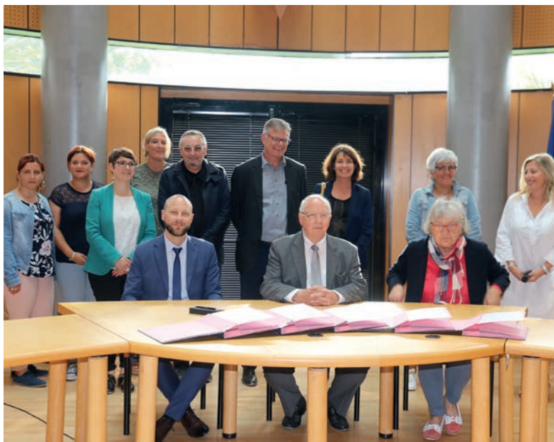
Signature de la convention de partenariat avec les partenaires