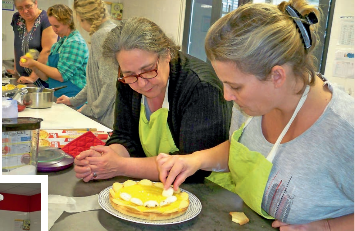
Bonne ambiance et convivialité font partie des recettes proposées lors des ateliers de l'épicerie solidaire