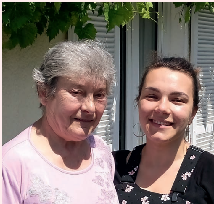
Imaginé à Londres depuis plus de 20 ans, le partage de logement entre jeunes et seniors s'est fortement développé en France ces dernières années.

Depuis une dizaine d'années, le phénomène augmente dans les grandes villes de France. Plutôt que de rester seuls dans leur demeure devenue trop grande sans les enfants, des seniors proposent l'hospitalité à une personne jeune, en échange d'un peu de présence et d'une petite participation financière non imposable. Pour le jeune, c'est un moyen de mener ses études ou de prendre son envol professionnel de façon sécurisée et économique, puisque ce logement est éligible aux APL. Pour les seniors, la présence rafraîchissante et sécurisante du jeune, les moments conviviaux partagés ensemble apportent de la vie. Une condition : disposer d'une chambre individuelle disponible. Une envie : aider un jeune à effectuer ses études ou à commencer son activité professionnelle dans un environnement serein. Et ainsi, transmettre et partager des expériences et du temps.