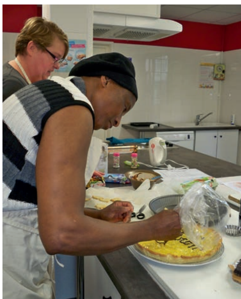
Des ingrédients simples et adaptés à la saison pour des recettes toujours savoureuses.